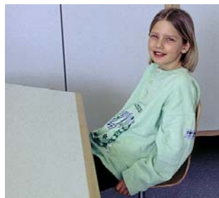
Beispiele für dynamisches oder bewegtes Sitzen